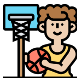
Rysunek 3: Ten rysunek jest w bieżącym miejscu tekstu. Wysokość to 2 cm.

sapien. Nullam tempor nibh in dapibus maximus. Curabitur posuere ex vel risus imperdiet fringilla. Suspendisse potenti. Morbi pulvinar eros neque, at scelerisque orci lacinia molestie. Morbi facilisis dolor sed elit ullamcorper, sit amet molestie augue semper. Aliquam non malesuada lorem, ac gravida leo. Nullam fringilla dolor ac pulvinar condimentum. Suspendisse finibus, mauris et consectetur hendrerit, purus leo aliquet tellus, a mollis lorem urna sed tortor. Phasellus consectetur vestibulum ante, ac molestie purus sollicitudin nec. Sed fermentum pulvinar velit.