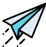
Rysunek 2: Ten rysunek jest na dole strony. Szerokość to 2 cm.

Etiam in turpis non dolor tempor tincidunt sed vitae est. Phasellus quis arcu quam. Pellentesque nulla mi, interdum nec dictum vitae, fermentum sed sapien. Nullam tempor nibh in dapibus maximus. Curabitur posuere ex vel risus imperdiet fringilla. Suspendisse potenti. Morbi pulvinar eros neque, at scelerisque orci lacinia molestie. Morbi facilisis dolor sed elit ullamcorper, sit amet molestie augue semper. Aliquam non malesuada lorem, ac gravida leo. Nullam fringilla dolor ac pulvinar condimentum. Suspendisse finibus, mauris