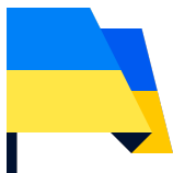
Rysunek 2: Ten rysunek jest na dole strony. Szerokość to 2 cm.

Etiam in turpis non dolor tempor tincidunt sed vitae est. Phasellus quis arcu quam. Pellentesque nulla mi, interdum nec dictum vitae, fermentum sed sapien. Nullam tempor nibh in dapibus maximus. Curabitur posuere ex vel risus imperdiet fringilla. Suspendisse potenti. Morbi pulvinar eros neque, at scelerisque orci lacinia molestie. Morbi facilisis dolor sed elit ullamcorper, sit amet molestie augue semper. Aliquam non malesuada lorem, ac gravida leo. Nullam fringilla dolor ac pulvinar condimentum. Suspendisse finibus, mauris et consectetur hendrerit, purus leo aliquet tellus, a mollis lorem urna sed tortor. Phasellus consectetur vestibulum ante, ac molestie purus sollicitudin nec. Sed fermentum pulvinar velit.