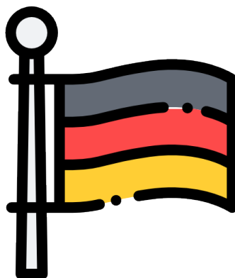
Rysunek 2: Ten rysunek jest na dole strony. Szerokość to 2 cale.

Etiam in turpis non dolor tempor tincidunt sed vitae est. Phasellus quis arcu quam. Pellentesque nulla mi, interdum nec dictum vitae, fermentum sed sapien. Nullam tempor nibh in dapibus maximus. Curabitur posuere ex vel